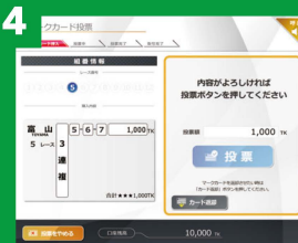
4 投票内容を確認し投票ボタンをタッチ