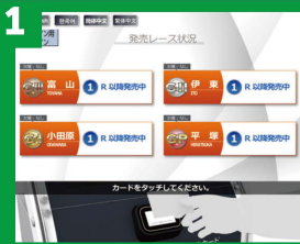
1 会員カードを投票機にタッチ