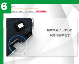
6 レシートを取ります