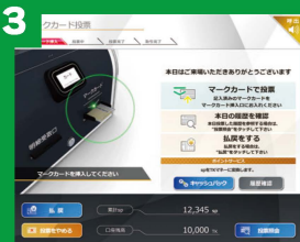
3 マークカードを挿入